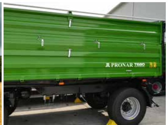
Auf Wunsch bieten wir beim Modell T680 durchgehende Bordwände an