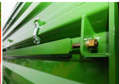
Spannleisten zur Stärkung der Bordwandprofile