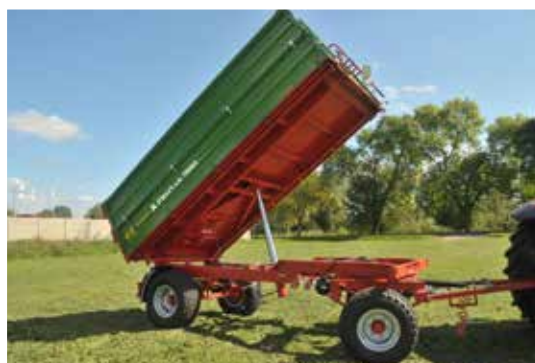
Ladekiste mit dreiseitigem Öffnungssystem und konischem Boden (Anhängerbreite erweitert sich heckseitig um 50 mm)