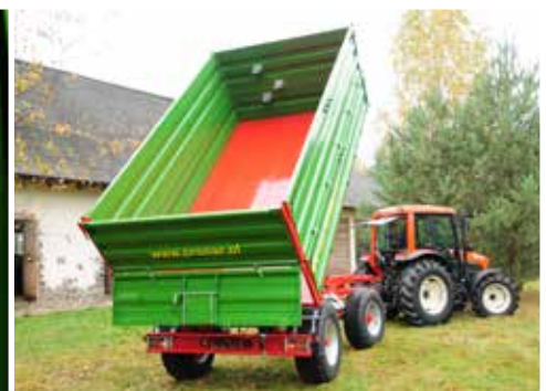
PT612L verfügt über ein Dreiseiten-Kippsystem