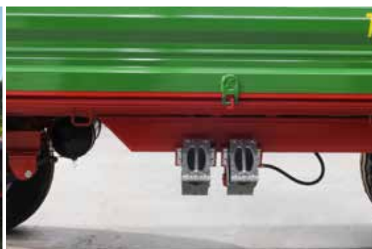
Radkeile mit sicheren Haltevorrichtungen als serienmäßige Ausrüstung