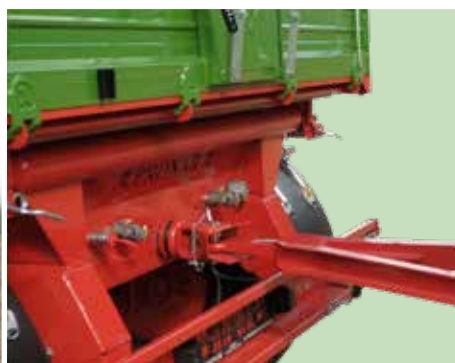
Hintere Anschlüsse zur Anhängung eines zweiten Anhängers