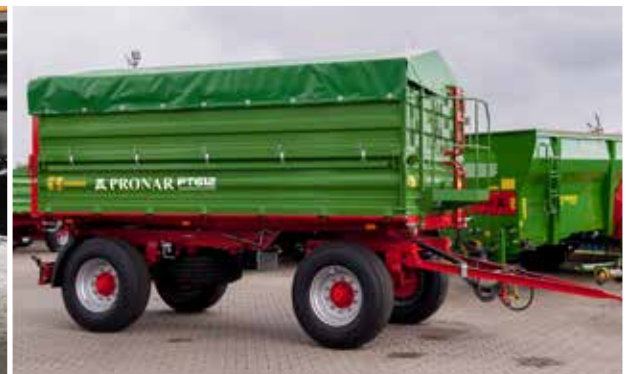
PT612 mit Rollplane, Gestell (klappbar) und Podest