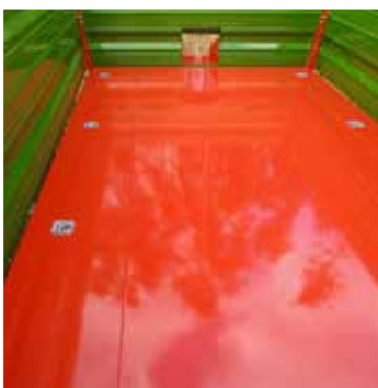
Zusätzliche Ladungssicherung mit im Anhängerboden verankerten Zurrösen möglich