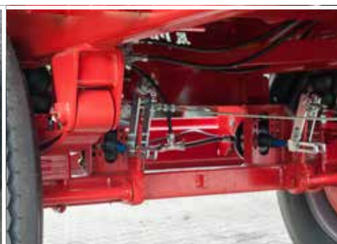
Solide Parabelfederung erhöht den Fahrkomfort