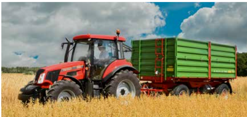
T680 mit geteilten Bordwänden bei der Ernte