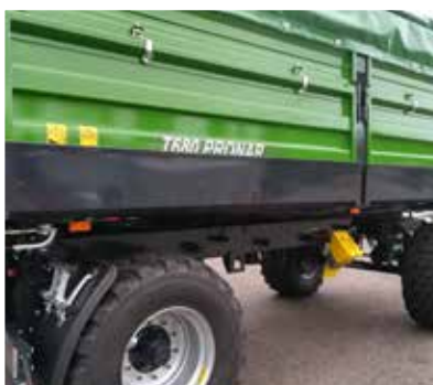
Seitliche, klappbare Blechrutsche (links o. rechts), erleichtert das Entladen