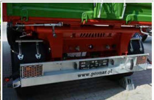
Homologierte Stoßstange mit integrierten LED-Rückleuchten und abnehmbarem Schutzgitter