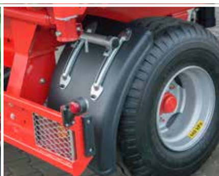
Kotflügel auf der Hinterachse und Rücklichter mit Schutzgitter