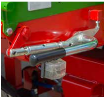
Zentralverriegelung an drei Seiten zur Erleichterung der Bordwandöffnung