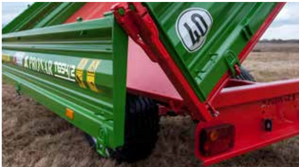
Kippwinkel: nach hinten 50°, nach links und rechts 46°