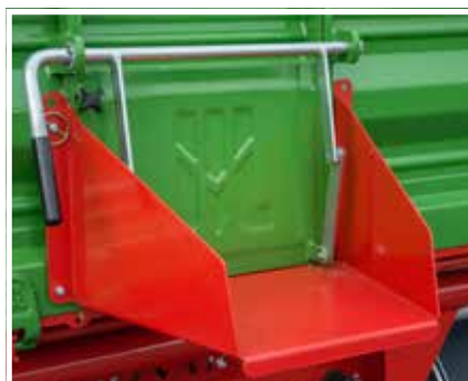
Optionale Auslaufgasse ermöglicht gezielte Entladung