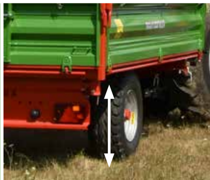
Niedrige Plattformhöhe erleichtert das Beladen