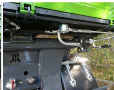
Nutzerfreundliche, hydraulische Bordwandentriegelung (Option)