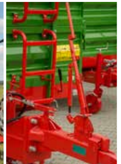
Auflaufdeichsel mit starrer Zugöse Ø40