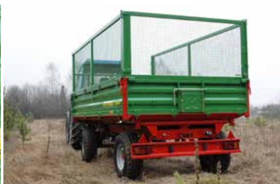
Optionale Gitteraufsätze (1000 mm) zum sicheren Transport von leichtem Grobmaterial