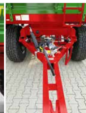
Y-Deichsel mit Zugöse Ø40 starr (Option)