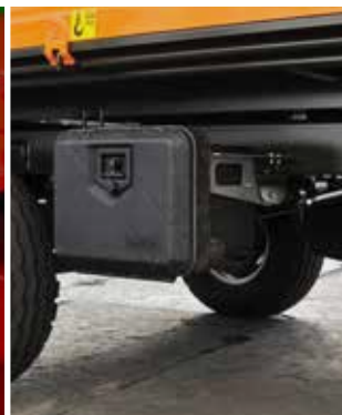
Werkzeugkasten als praktische Option