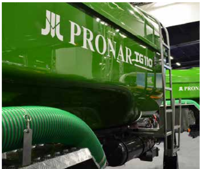
Aufstiegsleiter (einklappbar) erleichtert den Zugang zur Tankluke