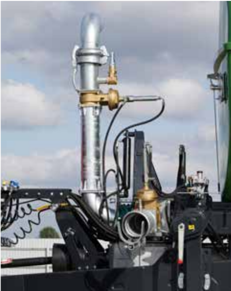
Saugrohr sowohl vertikal, als auch horizontal verstellbar - individuell angepasst an jeden Betrieb