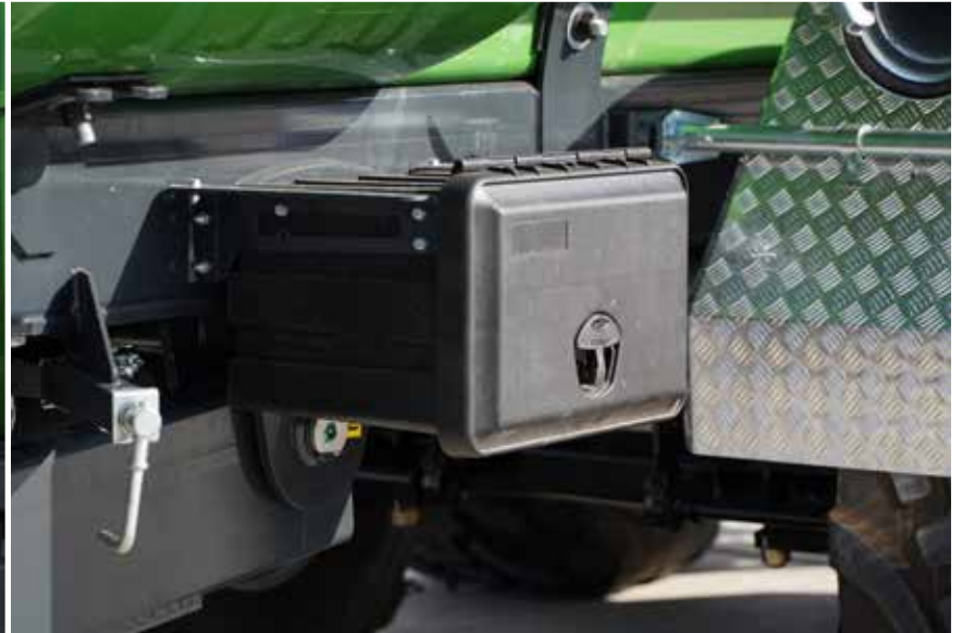
Jederzeit griffbreite Werkzeuge dank optionalem Werkzeugkasten