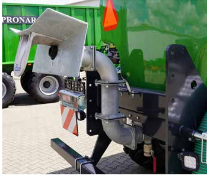
Exaktverteiler "Eisele" mit bodenwärtsgerichtetem Prallkopf ermöglicht windunabhängig breite Ausbringung