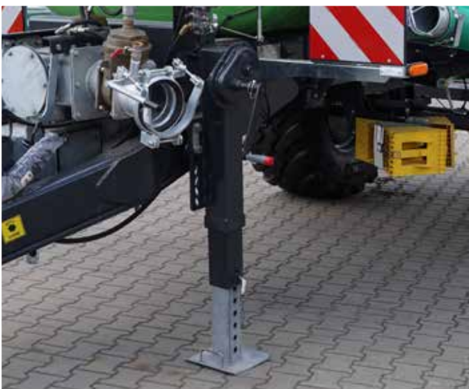
Teleskopstützfuß mit zweistufigem Getriebe