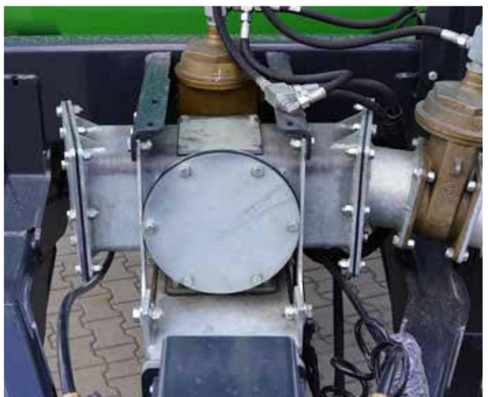
Schraubenspindelpumpe erlaubt nahezu drucklosen Betrieb mit hohem Wirkungsgrad, geringer Schaumbildung und vergleichsweise tieferem Saugpunkt als bei Vakuumumpfen