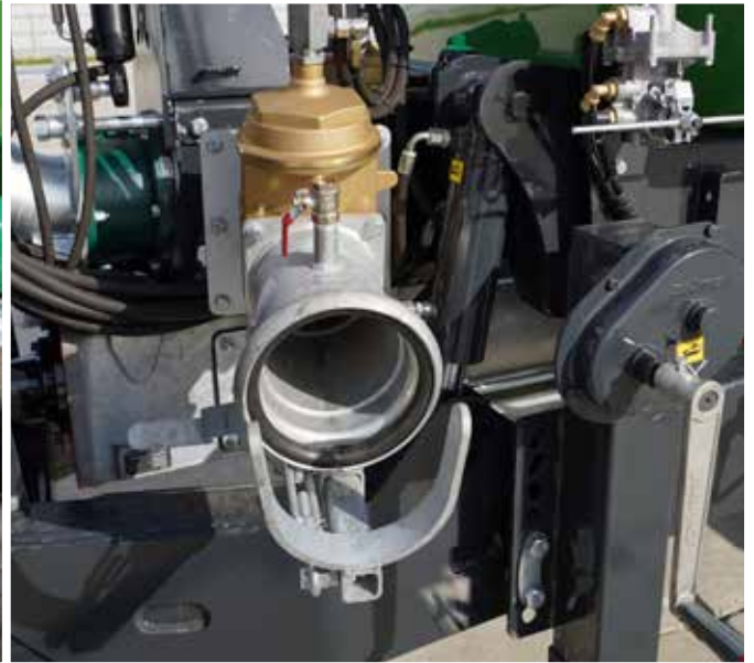
Perrot-Schnellkupplung und Ventil mit Hydraulikzylinder