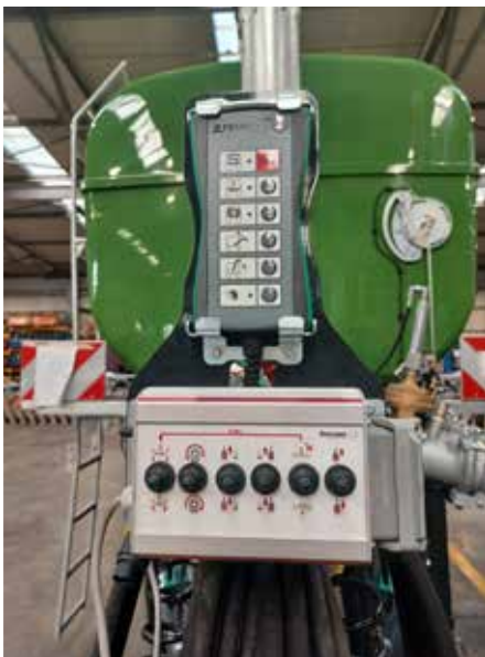
Selbsterklärende Bedienung des Wagens, als auch des Schleppschuhs