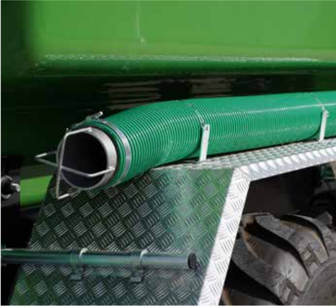
2 x 4m lange 6-Zoll-Saugrohre (Perrot-Schnellkupplungen) befinden sich auf beiden Seiten des Fahrzeugs oberhalb der Kotflügel