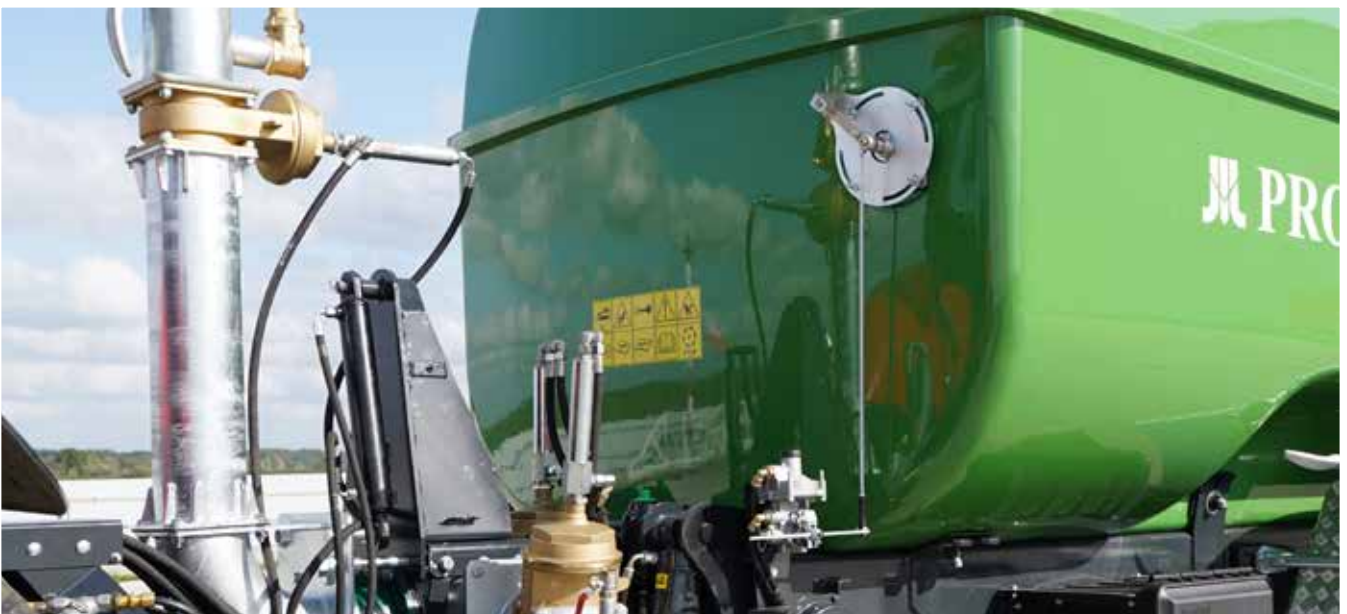
Mit dem ALB-System verbundene Füllstandanzeige als zusätzliche Sicherheitsvorkehrung während der Fahrt