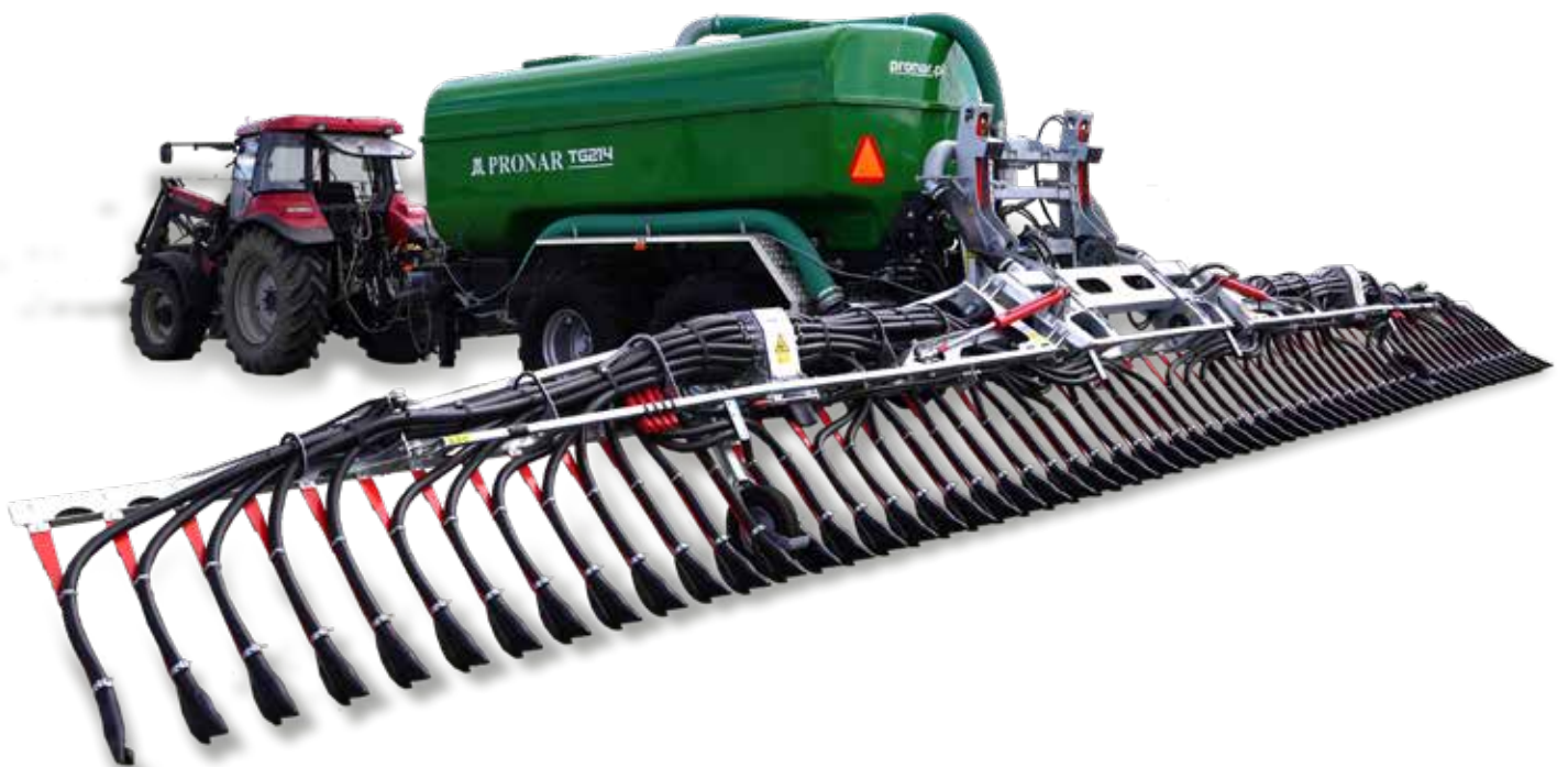
TG214 mit Vogelsangs "Blackbird" - Schlepsschuhgestänge