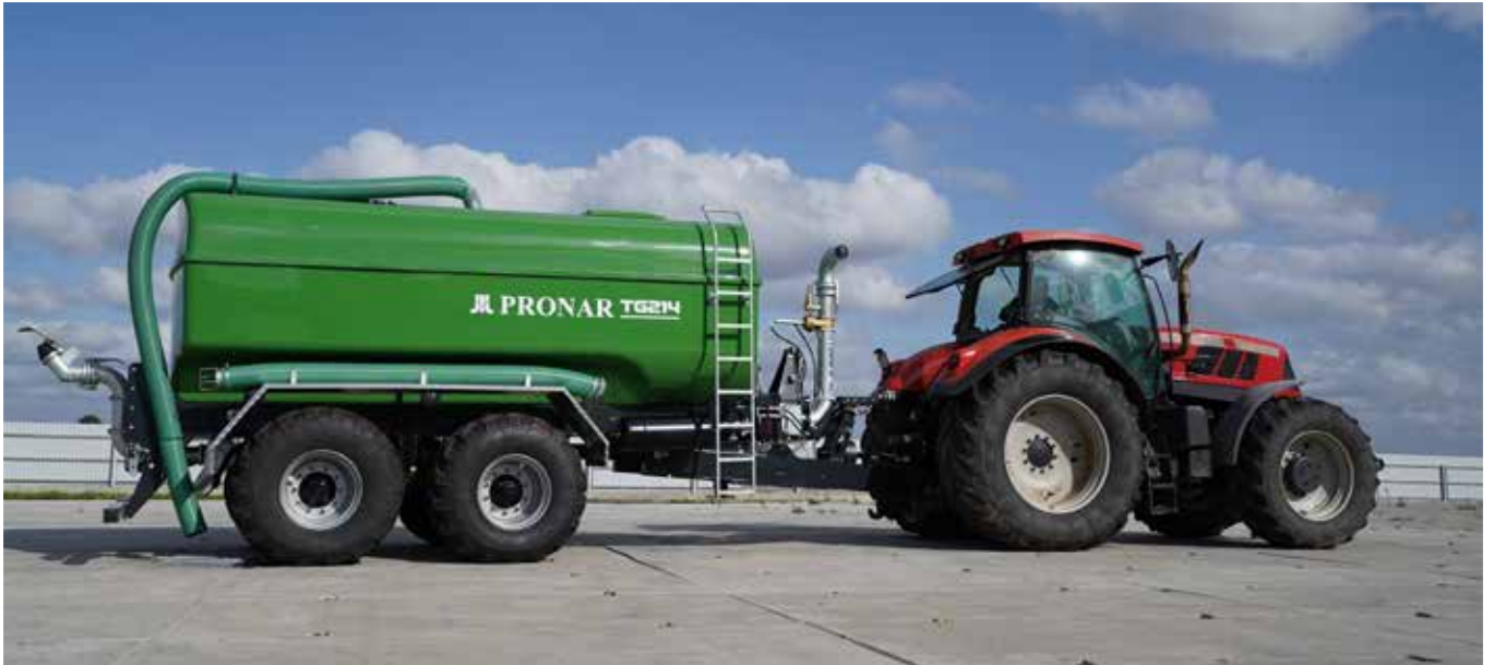
Der mit Glasmatten verstärkte Kompositttank, sowie dessen optimale Beschichtungsstärke garantieren eine enorme chemische Widerstandsfähigkeit und erhöhen die Lebensdauer des Produktes